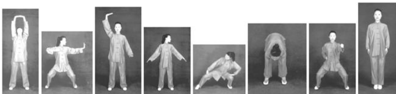
Gambar 1. Latihan baduanjin terstandar dari asosiasi qigong kesehatan cina 11

mengevaluasi respon secara global dan terintegrasi dari semua sistem yang terlibat dalam latihan, termasuk sistem kardiovaskular, respirasi, sirkulasi sistemik, darah, unit neuromuskular, dan metabolisme otot. 9